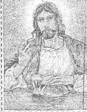
(Vangelo secondo Giovanni 14, 1-12)

"IO SONO LA VIA, LA VERITA' E LA VITA. DICE GESU'."